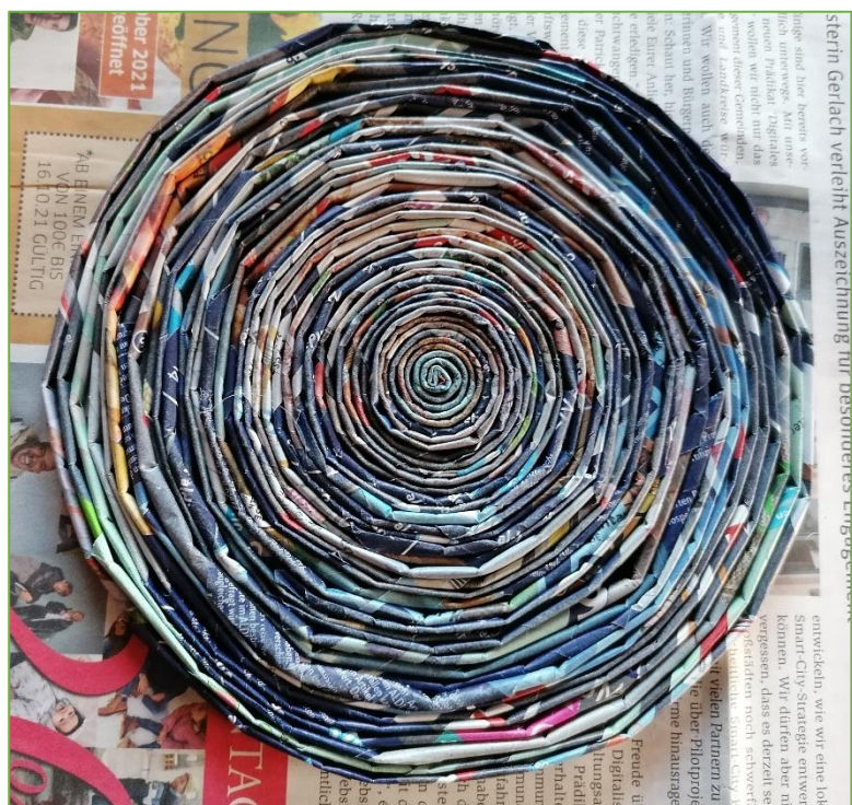
Figure 2 Scheibe herstellen